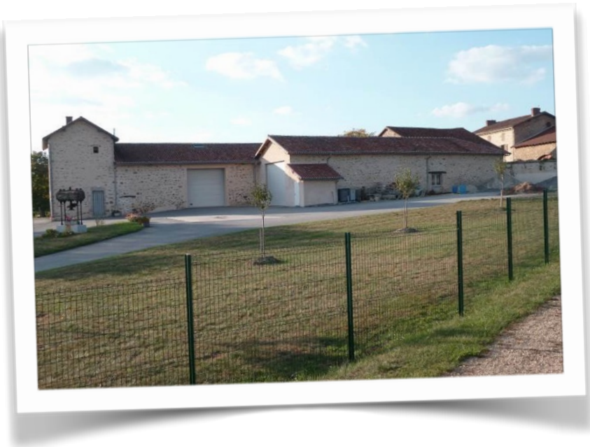
Local des services techniques.