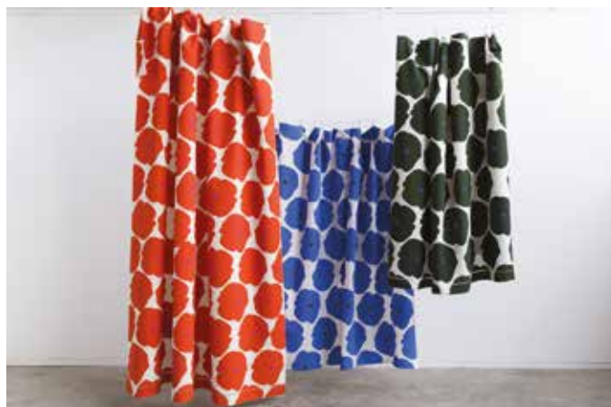
La collection POPPY est disponible en 3 couleurs (ORANGE – BLEU CIEL – VERT OLIVE) Dimensions : 2,20m x 3,10m

Et bien c'est exactement dans cette démarche écologique et artisanale que Lucile Le Priellec s'inscrit. Ses projets personnels, en sérigraphie par exemple, commencent par le recyclage de toiles métis qu'elle blanchit et qu'elle imprime en sérigraphie ensuite. Sa nouvelle collection de tissus imprimés sur d'anciennes toiles est un bel exemple de son talent et de sa démarche écoconceptuelle. La composition de ces tissus est 100% naturelle (coton/lin) et la qualité des fibres et du tissage assure une grande durabilité.